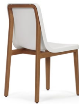
Nussbaum, PU-Schale weiß Walnut, PU seat white