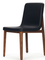
Nussbaum, Leder schwarz Walnut, leather black