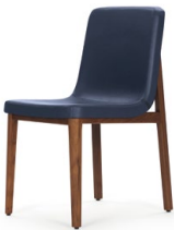
Nussbaum, Leder blau Walnut, leather blue