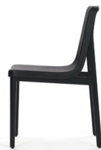
Eiche schwarz, PU-Schale schwarz Oak black, PU seat black