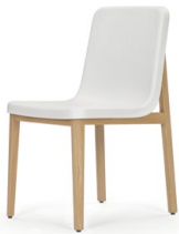
Eiche, PU-Schale weiß Oak, PU seat white

Estructura de madera maciza, barnizada en color natural o negro, lacado transparente. Cuerpo del asiento en espuma rígida de poliuretano en negro o blanco, o cuerpo del asiento con acolchado de poliuretano y tapicería de tela o piel.