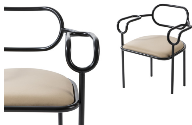
seduta con braccioli - chair with armrests

Originally designed by Shiro Kuramata in 1979, 01 Chair pays homage to the 80s and to the refined Japanese designer, who started to collaborate with Cappellini in that decade. The structure, made of polish chromed or anthracite matt lacquered iron tube, draws a light volume, characterized by the succession of lines and arches sinuously intertwined. The seat upholstery is fixed in the leathers of the collection.