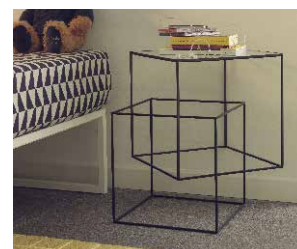
THIN BLACK TABLE

Bambi | Lucky | Peg Bed | Peg Chair | Koeda | Tuta | Waku