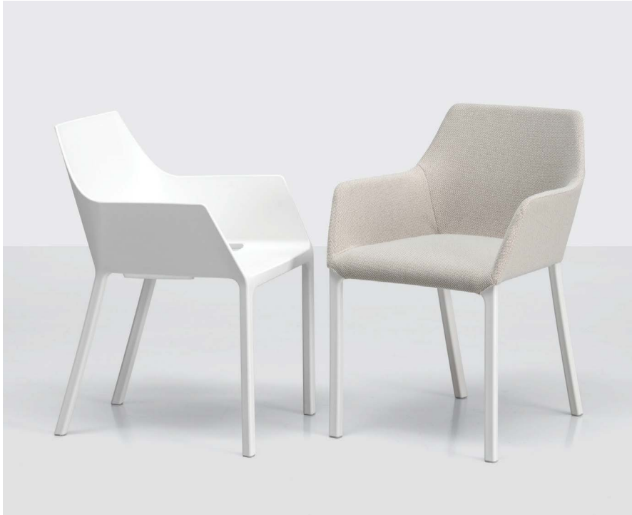
Mem vs Mem Soft