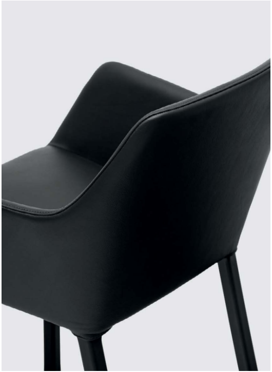
Upholstered in leather