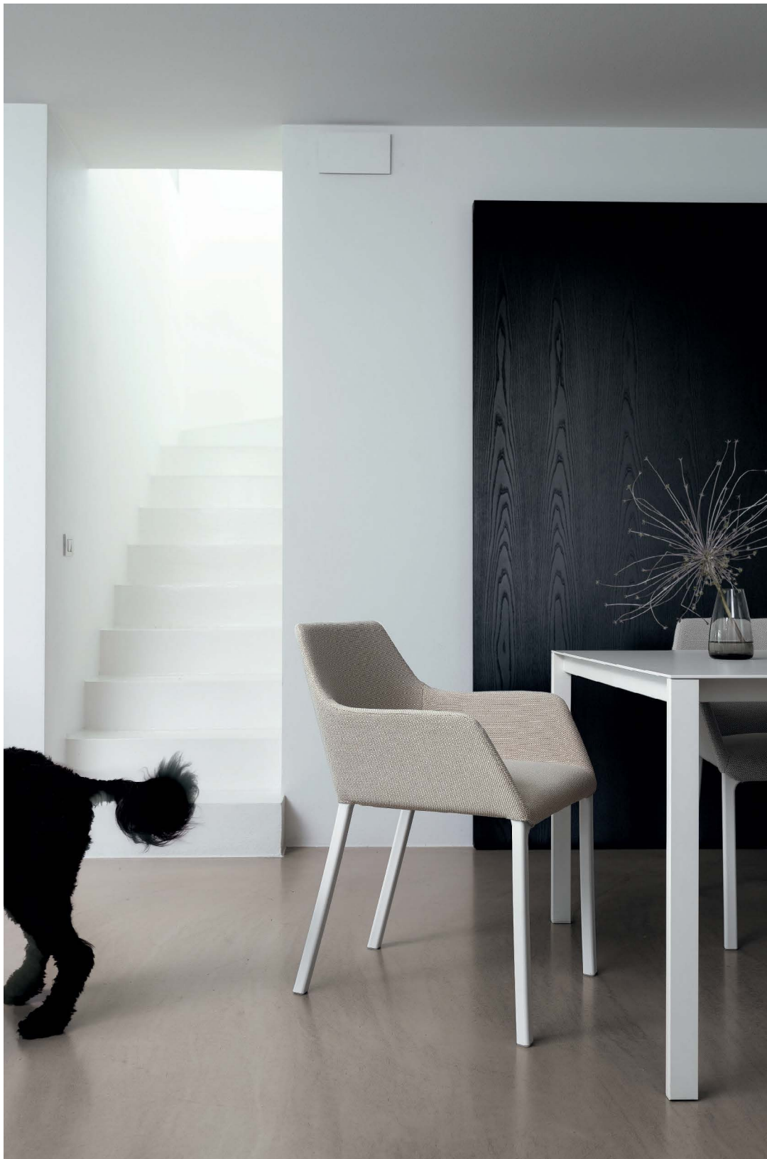
Mem Soft armchair Upholstered Hallingdal 65 fabric