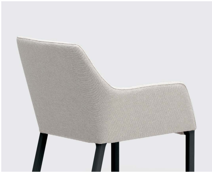
Upholstered in fabric