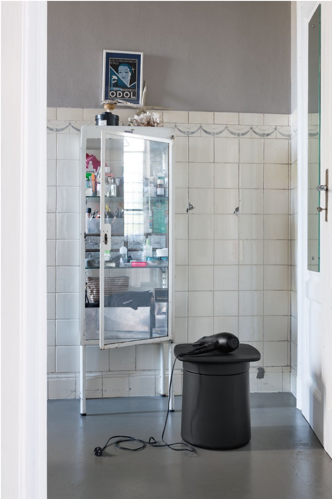
Degree occasional table Polypropylene