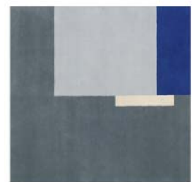
ROQUEBRUNE 1925 - 1935