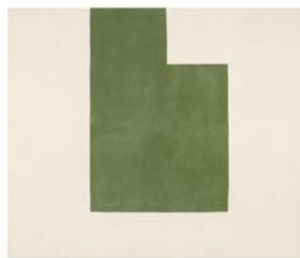
KILKENNY 1925 - 1935