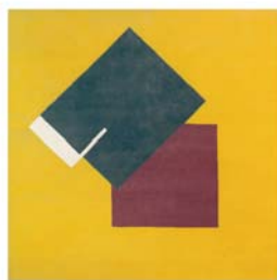
CASTELLAR 1925 - 1935