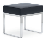
BANU STOOL 1931