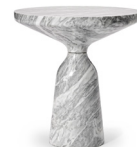
BELL TABLE MARBLE 2023