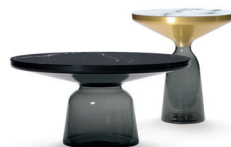
BELL SIDE & COFFEE TABLE 2012