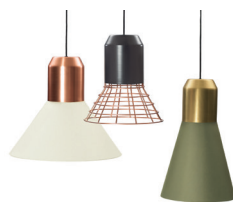
BELL LIGHT PENDANT LAMP 2013