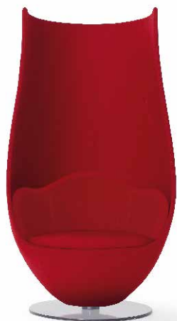
WANDERS' TULIP ARMCHAIR

A re-visitation of the classic armchair, with elongated oversized proportions, Wanders' Tulip Armchair has a shell made of fibreglass and resin; padded with soft and firm polyurethane foam; the fixed cover is available in a vast array of fabrics and leathers. The calyx shape of the armchair evokes the silhouette of a flower resting on a brilliant swivelling metal base, varnished with natural aluminium.