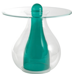
verde smeraldo / emerald green

Service tables available in two colors, composed by blown glass parts and extralight glass plate parts.