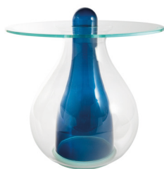
blu avio / avio blue

MYA1 tavolino alto, Ø60 cm MYA2 tavolino basso, Ø90 cm