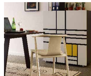
HOMAGE TO MONDRIAN

Dinah | Progetti Compiuti | Pyramid | Revolving Cabinet | Sofa with arms | Steel Pipe Drink Trolley