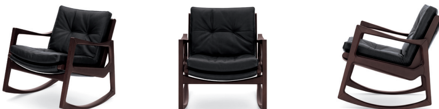
Eiche braun gebeizt, Leder schwarz Oak brown-stained, leather black