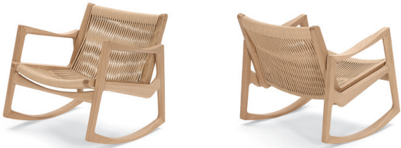
Eiche natur, Kordel hanffarben Oak, cord hemp-coloured

Estructura de madera maciza, con lacado transparente o barniz oscuro. A elección, malla de cordel o con acolchado de poliuretano con cintas de goma y tapicería de tela o piel. Para más detalles, colores y normas europeas, ver lista de precios.