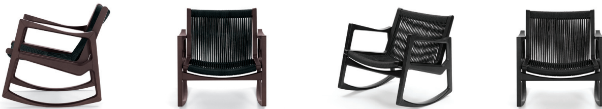
Eiche braun gebeizt, Kordel schwarz Oak brown-stained, cord black