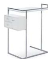
PETITE COIFFEUSE 1929