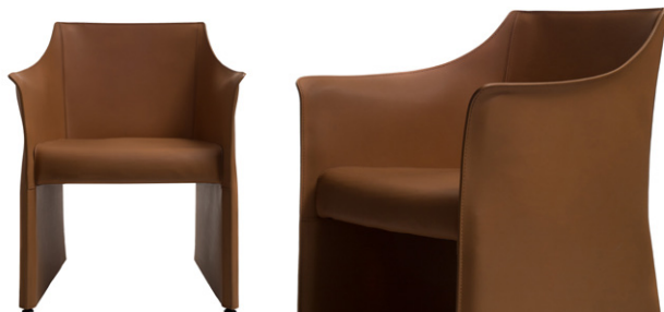
CAP CHAIR 2

California Technical Bulletin 117 - 2013, Sez. A part 1, Sez D part 2.