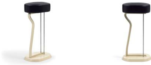
Weiß, Leder schwarz white, leather black

Estructura de acero fijada en disco de acero lacado en negro o blanco crema. Dos varas de acero acabadas en mate. Acolchado: poliuretano con espuma. Tapicería de cuero. Detalles y colores ver lista de precios.