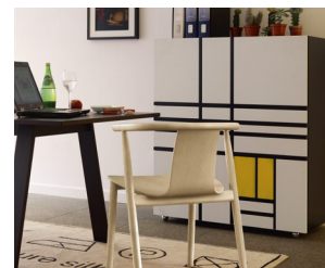
HOMAGE TO MONDRIAN

Dinah | Progetti Compiuti | Pyramid | Revolving Cabinet | Sofa with arms | Steel Pipe Drink Trolley