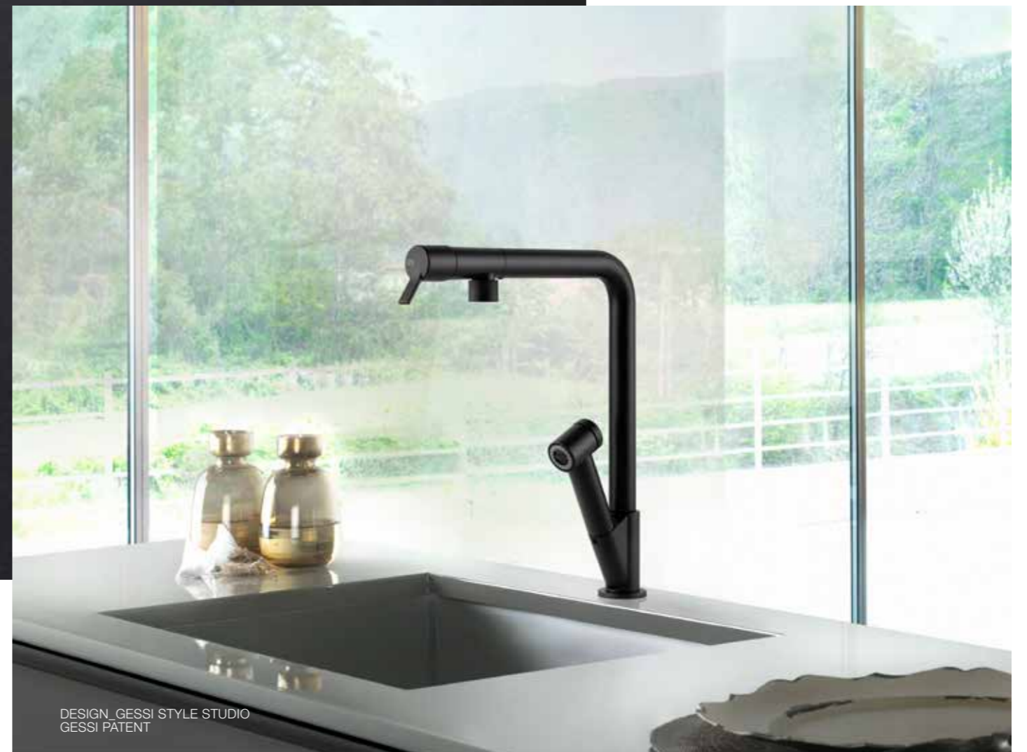
DESIGN_GESSI STYLE STUDIO GESSI PATENT