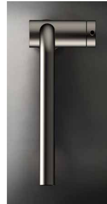
DESIGN_GESSI STYLE STUDIO GESSI PATENT