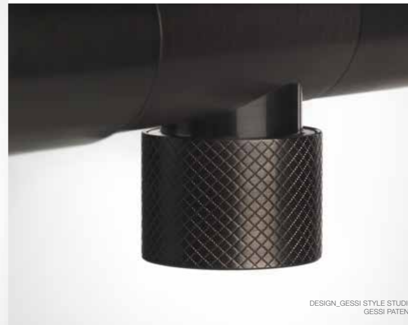
DESIGN_GESSI STYLE STUDIO GESSI PATENT

Gessi ha da tempo raccolto questa sfida, fornendo design glamour e brillanti soluzioni tecnologiche per rispondere a una richiesta di zone lavabo con personalità, estetica e funzioni avanzate. Poiché gli spazi abitativi diventano sempre più fluidi e aperti, molto spesso la cucina si apre al soggiorno, o il piano cucina ha poco spazio dedicato, a volte sotto una finestra. Ciò richiede una capacità del rubinetto di "scompare" discretamente contro il lavabo quando esso non sia in uso. Per questo Gessi ha sviluppato una serie di miscelatori abbattibili che possono essere estratti a piena altezza quando necessario e nondimeno azionati in qualsiasi posizione intermedia.