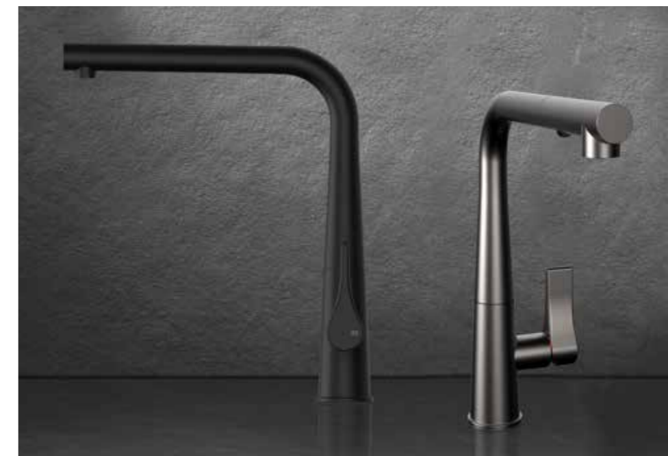
DESIGN_GESSI STYLE STUDIO GESSI PATENT