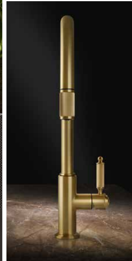
DESIGN_GESSI STYLE STUDIO GESSI PATENT