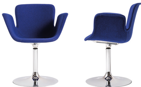
con scocca rivestita - with upholstered shell

Fully upholstered in fabric, the Juli Soft armchair sits on top of a base that comes in following versions: a column base; with 4 ash legs; with 4 or 5 aluminum legs; 4 tubular iron legs; with a sled base. Thanks to its remarkable stability, the robust injection-molded seat and the fresh, contemporary look, the Juli Soft armchair is the perfect solution for home and Contract settings, such as offices and restaurants.