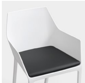
Mem removable cushion