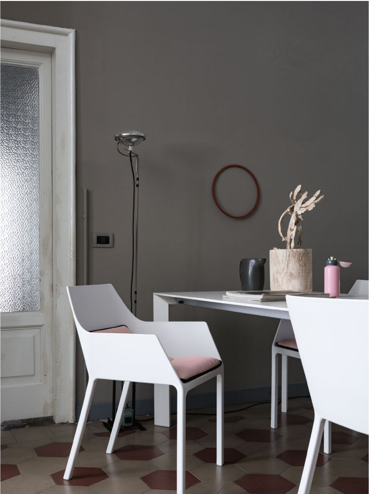
Mem armchair Polypropylene