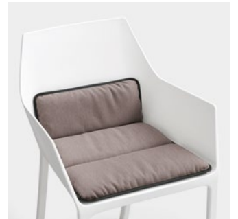
Lips—D removable cushion