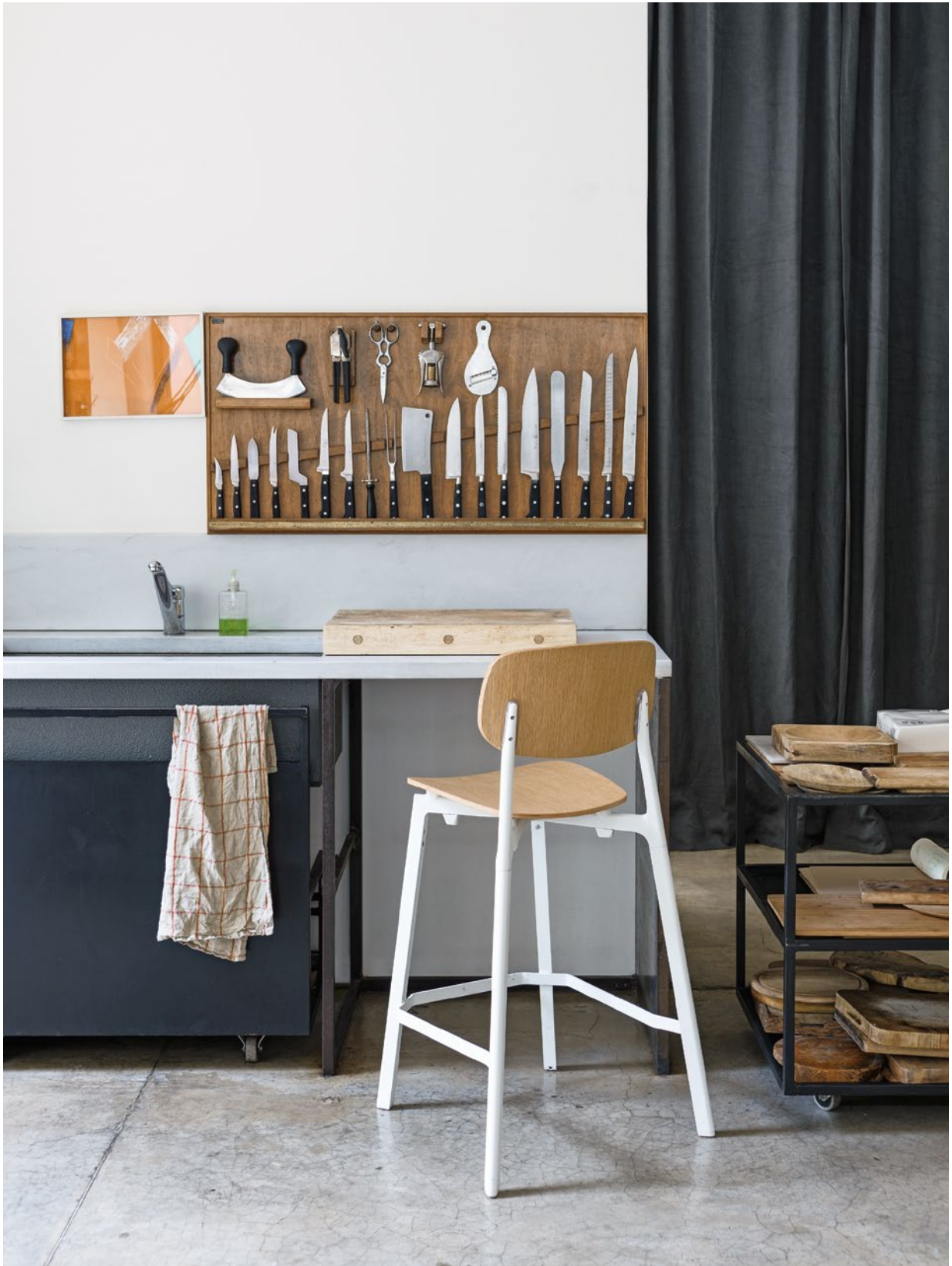
Colander stool Wooden body