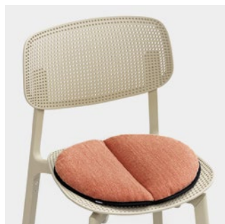
Lips-R removable cushion