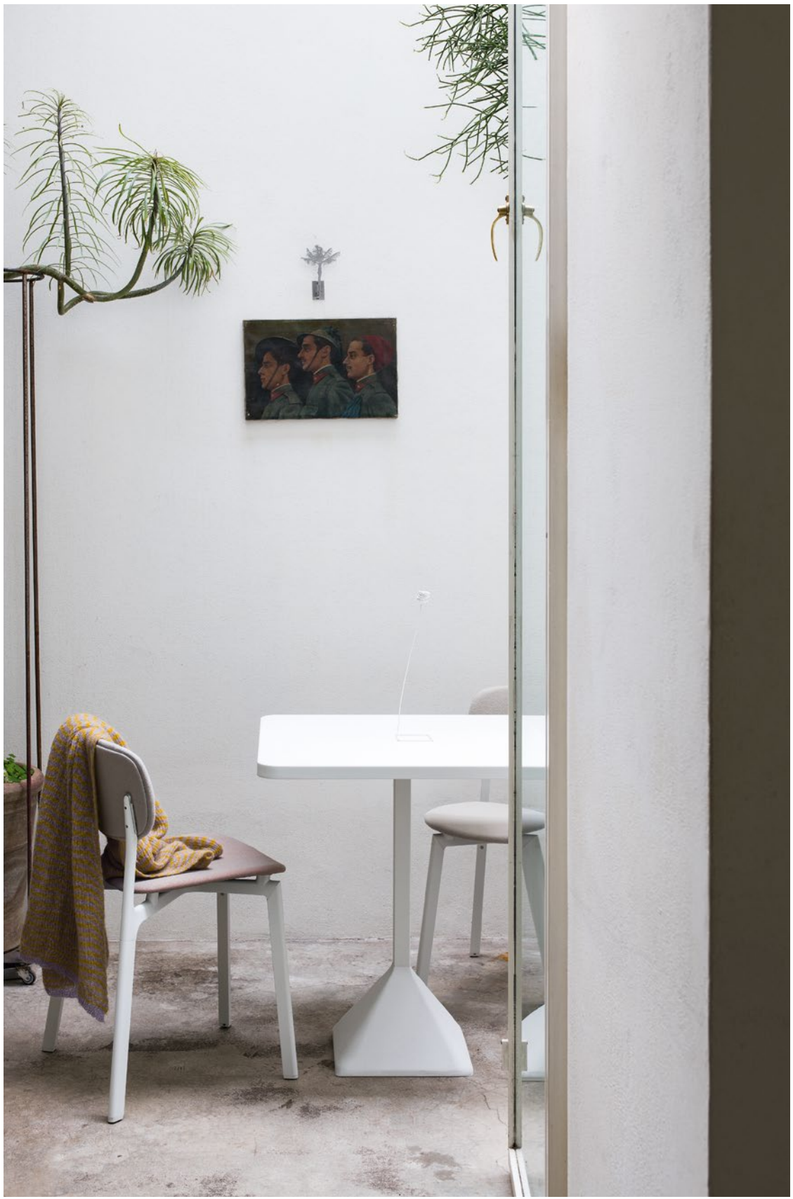
Colander chair Upholstered body