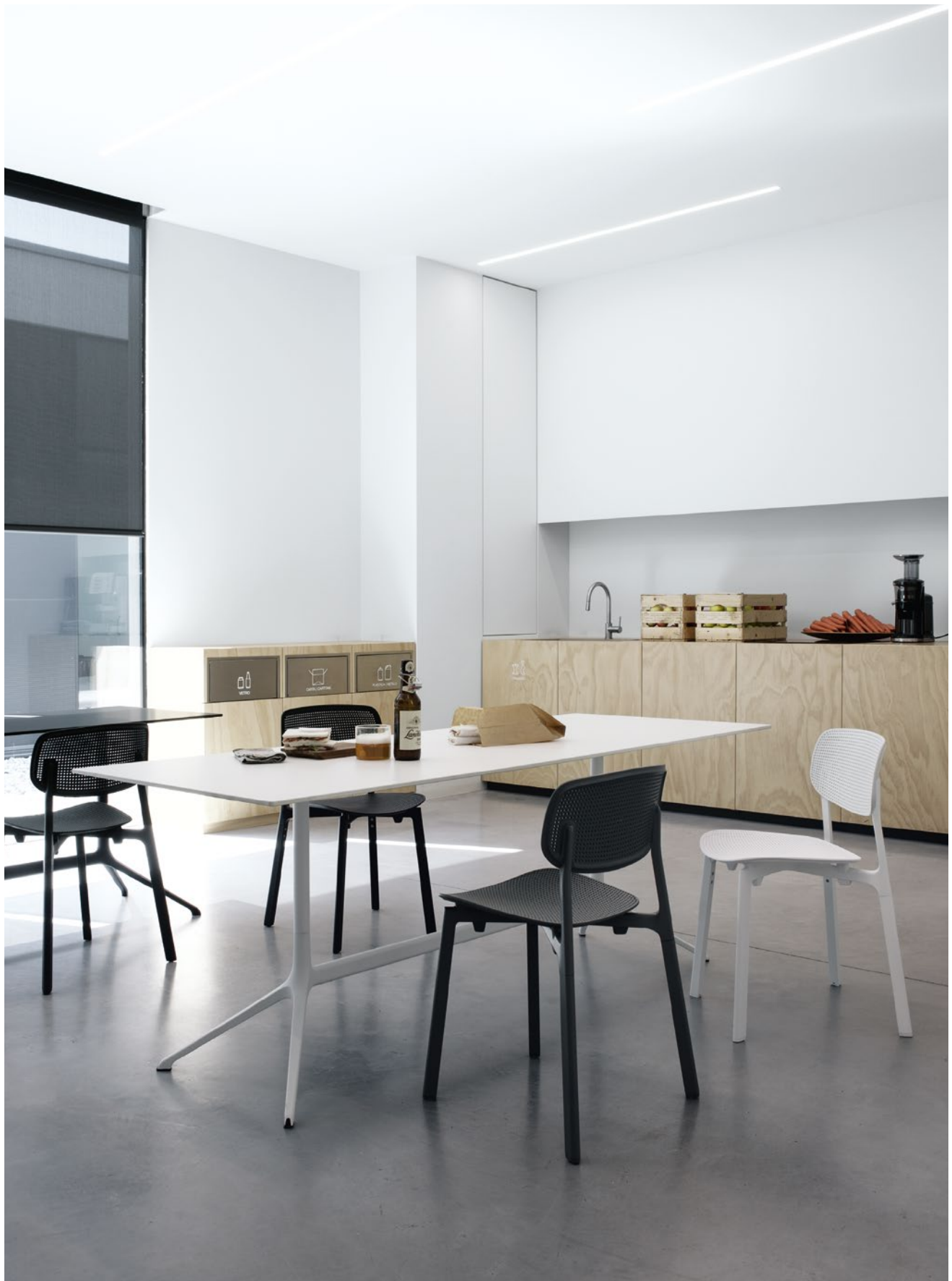
Colander chair Polypropylene body