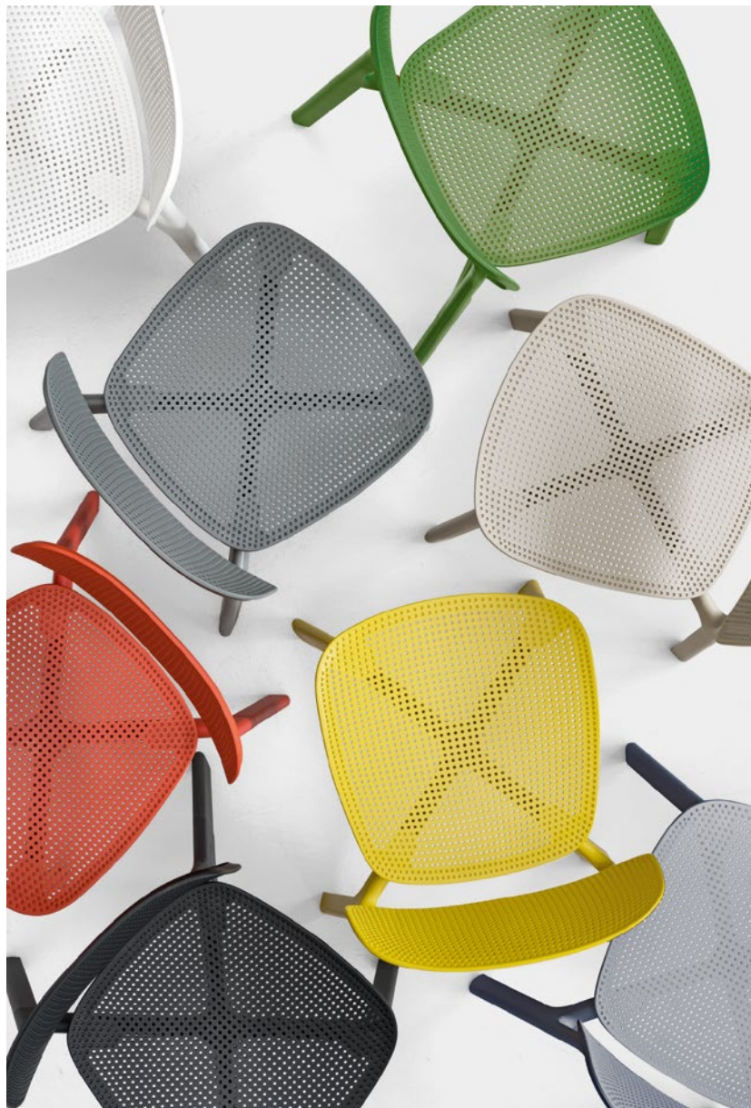
Colander chair Colour palette