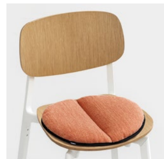
Lips-R removable cushion