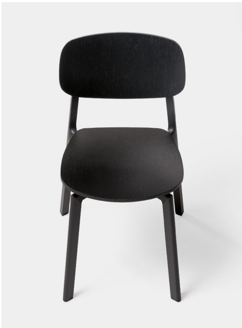
Colander chair Wooden body