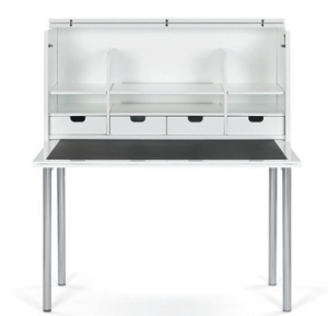
Weiß hochglanzlackiert White high-gloss lacquer